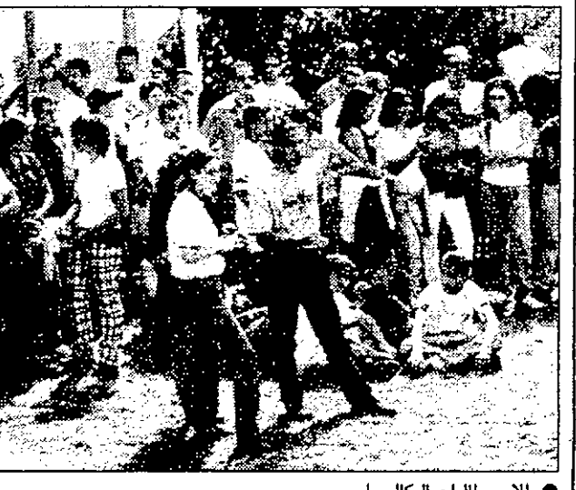
وفي البازار الخيري